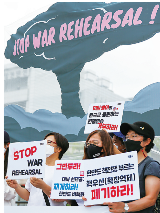
▲8月22日,集会者手持标语牌在韩国首尔参加集会反对韩美军演。韩美两国军队22日正式启动下半年“乙支自由之盾”联合军演。韩国多个民间团体当天在首尔举行抗议集会。