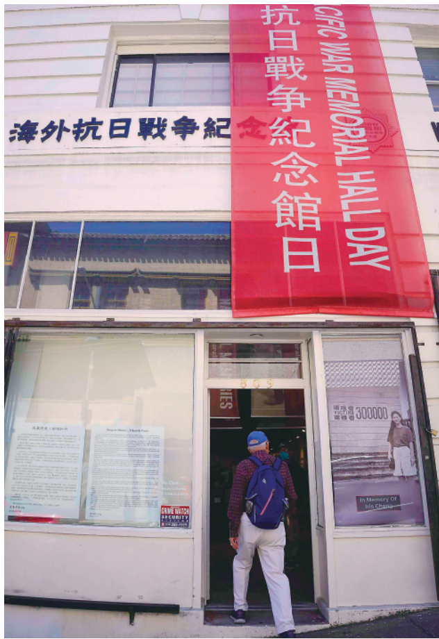
▲8月20日,在美国旧金山,一名男子进入海外抗日战争纪念馆参观。