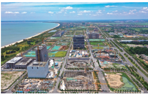
这是海口江东新区总部经济区(6月21日摄)。江东新区是海南自贸港重点园区之一,2020年6月正式挂牌。