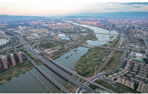
建设中的西安市灞河两岸(6月21日摄)。今年以来,西安市以重大项目建设为引擎,积极推动经济高质量发展。