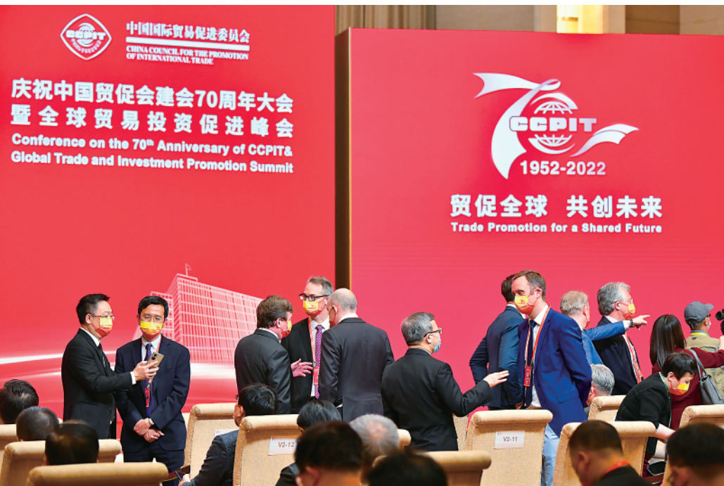
▲5月18日，与会嘉宾在大会开始前交流。

新华社北京5月18日电(记者谢希瑶)庆祝中国贸促会建会70周年大会暨全球贸易投资促进峰会18日在北京举行。中国贸促会代表与会工商界发布了《全球贸易投资促进峰会北京倡议》。 倡议提出了共同应对疫情挑战、促进世界经济企稳复苏、携手聚力跨越发展鸿沟、积极推进创新、推动绿色低碳可持续发展等方面内容。 倡议呼吁，维护和促进全球团结合作，反对将疫情政治化，进一步提振战胜疫情的信心与决心，全面深化在卫生健康领域的合作，保证发展中国家能够以公正、公平、快速、团结、可负担的方式获取这些全球公共产品，为弥合“免疫鸿沟”、守护生命健康作出积极努力。 倡议指出，要践行真正的多边主义，共同维护以世界贸易组织为核心的多边贸易体制，推动经济全球化朝着更加开放、包容、普惠、平衡、共赢方向发展；推动各国政府加强政策协同，推进贸易和投资自由化便利化，保障产业链供应链安全稳定畅通。 倡议强调，坚持行动导向，努力创造真正公平和包容的环境；促进公私部门合作，帮助最不发达国家和中小微企业充分融入全球价值链；加强人力资源交流合作，帮助发展中国家劳动者提升必要的工作能力和素质。 倡议还提出，坚持创新驱动，充分发挥技