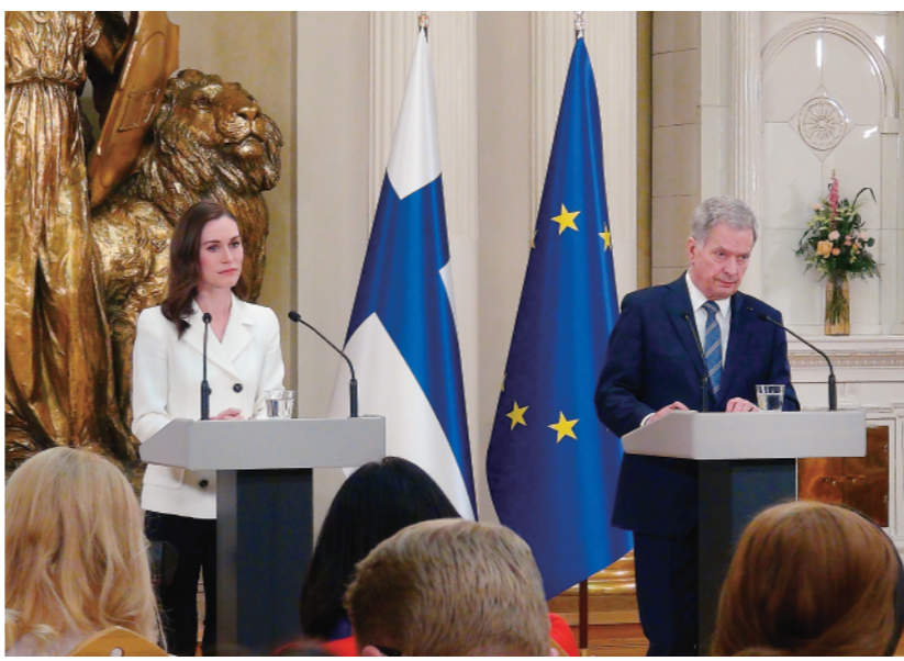
五月十五日,在芬兰赫尔辛基,芬兰总统尼尼斯托(右)和总理马林参加联合记者会。

心举行抗议示威,反对芬兰加入北约。活动组织者芬兰和平委员会认为,芬兰应努力成为解决冲突和建设和平的国家。