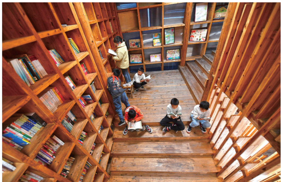
▲4月20日,坪坦乡中心小学学生在坪坦书屋内看书。