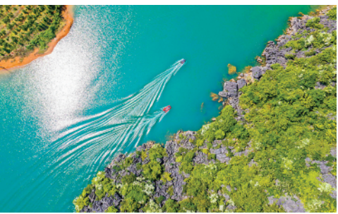
4月21日,在湖南省永州市道县寿雁镇乐海水库,护水志愿者乘坐快艇进行水上巡查作业。