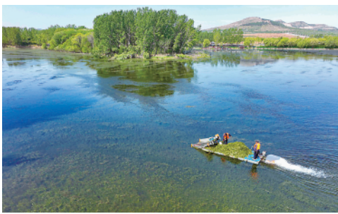
4月21日,在山东省青州市尧王湖,工作人员清理水草和垃圾。