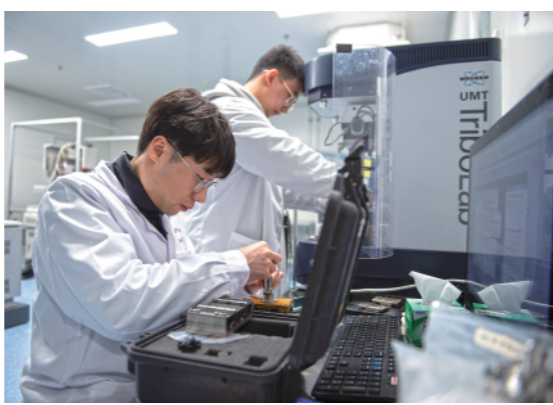
▲中国科学院北京纳米能源与系统研究所。