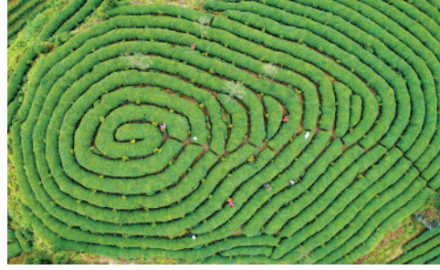
3月30日,茶农在蒙顶山上的茶园采摘茶青。四川雅安蒙顶山茶传统制作技艺是国家非物质文化遗产。

今日8版 总第10685期 / 国内统一连续出版物号CN 11-0209 邮发代号1-19 / 新华网:news.cn 新华每日电视网:mr dx.cn