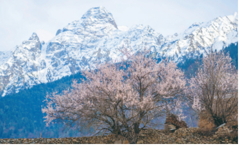
在那曲市嘉黎县尼屋乡拍摄的桃花(3月30日摄)。春天里,西藏那曲市嘉黎县尼屋乡桃花盛开。