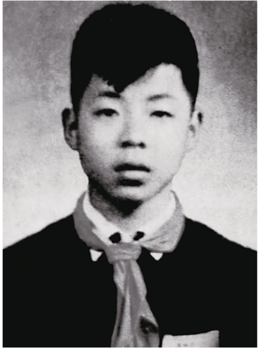
▲雷锋于1954年加入中国少年先锋队时的留影，这是迄今为止发现最早的一张雷锋单人照片。