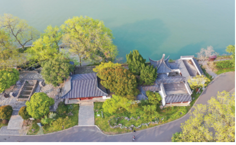
3月23日,游人在南京玄武湖公园游玩。时下,江苏南京春意盎然,处处花红柳绿,景色宜人。