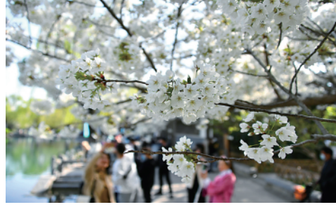
3月23日,在济南市环城公园,人们在欣赏绽放的樱花。近日,泉城济南各大公园内的樱花纷纷绽放。

新华通讯社主管主办 2022年3月24日 星期四 壬寅年二月廿二 新华通讯社出版