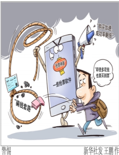
警惕 新华社发王鹏作

“加速”等级的区别不明确。除了字面区别，平台对低速、快速、高速、光速的等级并没有说明有什么不同。有