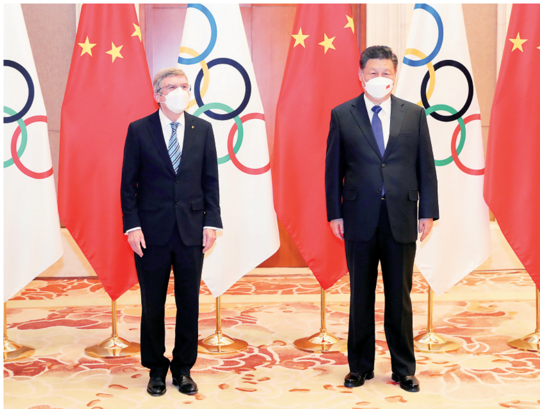
1月25日,国家主席习近平在北京钓鱼台国宾馆会见国际奥委会主席巴赫。