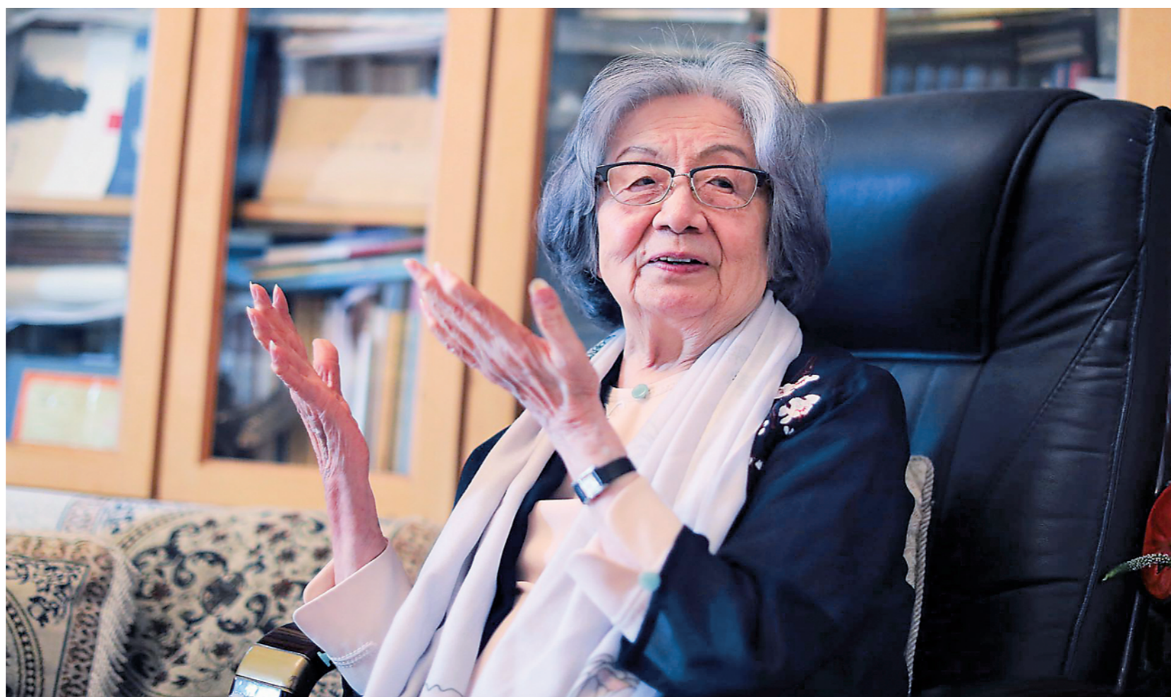
▲ 2020年7月,叶嘉莹先生96周岁寿辰,摄于南开大学寓所。

近日,这份尘封多年的课程录音被陆续整理出来,《草地》周刊征得叶嘉莹先生授权,开设“迦陵课堂”专栏,拟每周一课,刊发全部课程精要。诗词是叶先生的挚爱,她曾说,“我对诗词的爱好与体悟,可以说全是出于自己生命中的一种本能”。让我们跟随这种“本能”,一起聆听叶先生讲诗词,一起沉浸在诗词的世界里,一起领悟中华优秀传统文化之美。