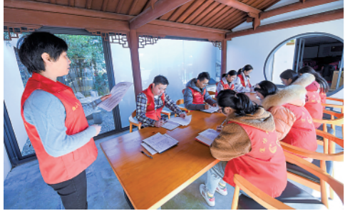
12月2日,在浙江湖州市吴兴区道场乡菰城村村委会内,“菰城之声”宣讲团的志愿者在进行六中全会精神宣讲集体备课。