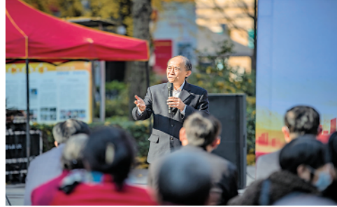
12月1日,在重庆江北区桃源社区,“老马”宣讲团成员、“时代楷模”马善祥在给社区居民宣讲六中全会精神。