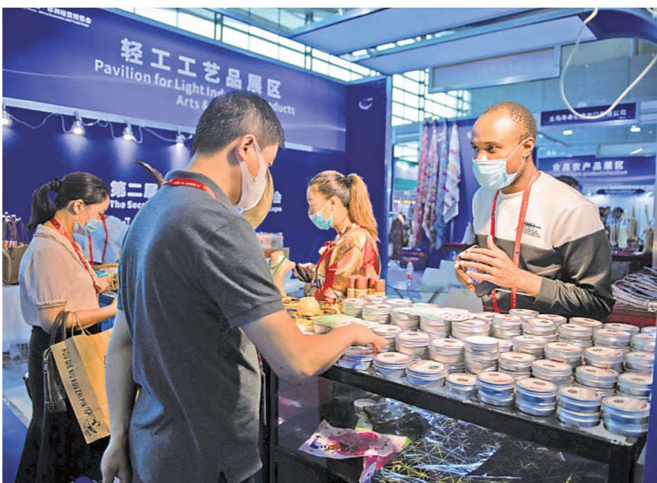
9月27日,在湖南长沙举行的第二届中国-非洲经贸博览会上,来自非洲的各種特色商品琳琅满目,引人注目。

白皮书指出,当前,中非关系处于历史最好时期,中非合作成果遍布非洲大地,改善了非洲经济社会发展条件,给双方人民