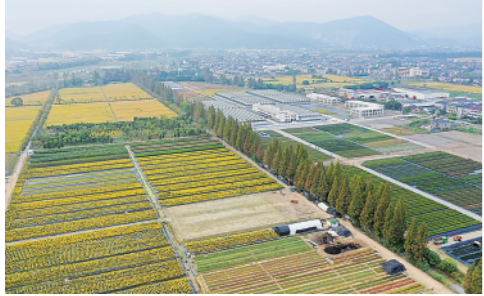
近年来,浙江杭州市西湖区双浦镇将曾经的甲鱼塘及各类堆场通过生态修复垦造为良田(11月3日摄)。

今日16版 总第10537期 / 国内统一连续出版物号CN 11-0209 邮发代号1-19 / 新华网:news.cn 新华每日电讯网:mr dx.cn