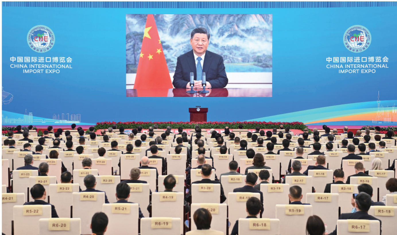
11月4日晚,国家主席习近平以视频方式出席第四届中国国际进口博览会开幕式并发表题为《让开放的春风温暖世界》的主旨演讲。

● 开放是当代中国的鲜明标识。今年是中国加入世界贸易组织20周年。这20年来中国的发展进步,是中国人民在中国共产党坚强领导下埋头苦干、顽强奋斗取得的,也是中国主动加强国际合作、践行互利共赢的结果 ● 一个国家、一个民族要振兴,就必须在历史前进的逻辑中前进、在时代发展的潮流中发展 ● 中国扩大高水平开放的决心不会变,同世界分享发展机遇的决心不会变,推动经济全球化朝着更加开放、包容、普惠、平衡、共赢方向发展的决心不会变