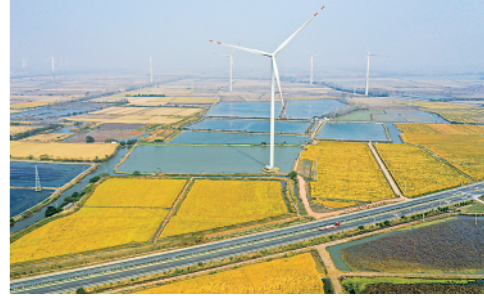
近年来,江苏宝应县大力发展“风光渔”互补产业发电、风力发电等,形成立体开发模式(11月3日摄)。