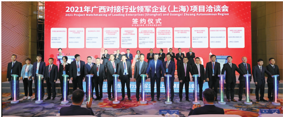
2021年广西对接行业领军企业（上海）项目洽谈会签约仪式

10月28日，2021年广西对接行业领军企业（上海）项目洽谈会举行。来自长三角地区的160多家“三类500强”企业、知名行业商会、行业领军企业的负责人共220多人参加了会议。