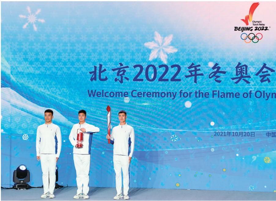
10月20日,在火种欢迎仪式上,三名护卫人员分别特引火棒、火种灯和火炬。

18日,北京冬奥会火种在希腊古奥林匹亚采集成功。仪式现场,当第一棒火炬手、手持北京冬奥会火炬“飞扬”的希腊高山滑雪运动员扬尼斯·安东尼乌,从扮演最高女祭司的希腊知名女演员乔治乌手中接过燃起的火炬时,从他火炬手服装的袖口、身侧直达脚底的红线,与“飞扬”火炬对接成完整的红色线条。这并非巧合,而是精心设计的一套完整的景观体系。