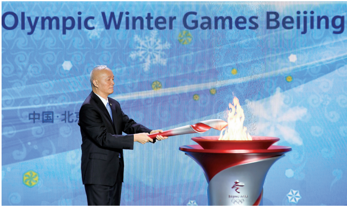
10月20日,在火种欢迎仪式上,北京市委书记、北京冬奥组委主席蔡奇点燃仪式火种台。