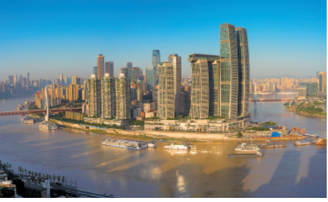
中秋节假期,沐浴在晨曦中的山城重庆,景色迷人(9月21日摄)。