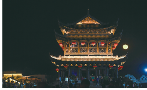
9月21日,市民和游客在浙江建德严州古城赏月。今年中秋,当古建与圆月相遇,展现出别样的中国之美。

今日8版 总第10493期 / 国内统一连续出版物号CN 11-0209 邮发代号1-19 / 新华网:news.cn 新华每日电视网:mr dx.cn