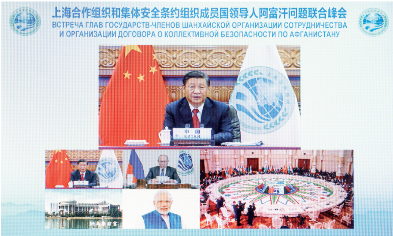
9月17日，国家主席习近平在北京以视频方式出席上海合作组织和集体安全条约组织成员国领导人阿富汗问题联合峰会并发表重要讲话。

新华社北京9月17日电 国家主席习近平17日下午在北京以视频方式出席上海合作组织和集体安全条约组织成员国领导人阿富汗问题联合峰会并发表重要讲话。 习近平指出，近期，阿富汗局势发生根本性变化，对国际形势、地区格局和安全稳定产生重要影响。目前，阿富汗面临不少困难和挑战，尽快恢复正常秩序，实现局势软着陆，是全体阿富汗人民的紧急要务，国际社会和地区国家也需要密切关注。上海合作组织和集体安全条约组织成员国都是阿富汗近邻，大家是命运共同体，