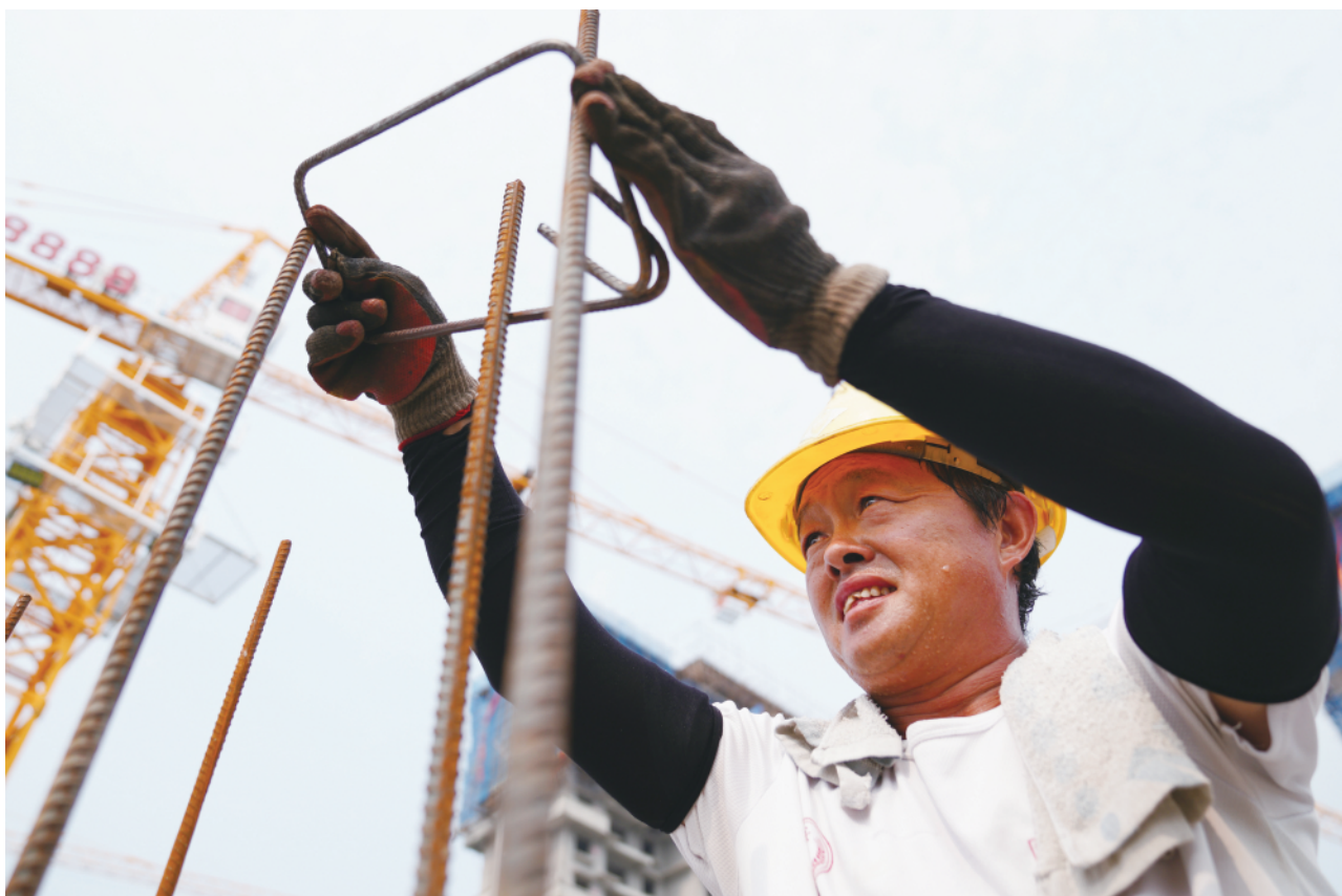
8月4日,建筑工人在河北邢台南官市山水如意住宅小区建设工地上绑钢筋。