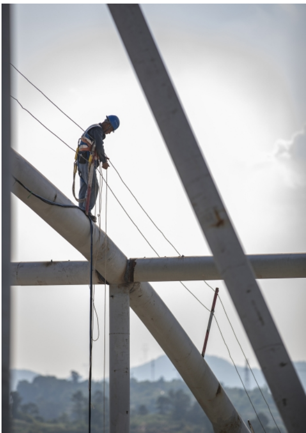
8月4日,中建八局施工人员在重庆龙兴足球场进行屋盖钢结构施工。