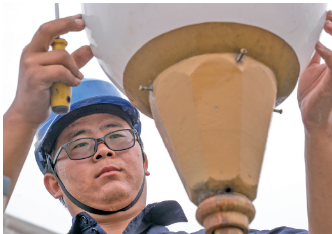
8月4日,河北沧州黄骅市城管局路灯所工作人员在检修路灯。