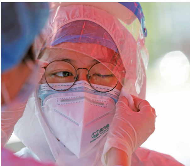
上图:8月2日,在河南省郑州市郑东新区一核酸检测点,医务工作者在同事的帮助下擦拭脸上的汗水。