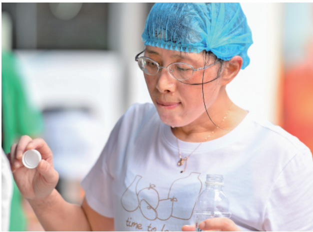
7月31日,在长沙市天心区赤岭路街道一个核酸检测点,医护人员在轮换时喝水。