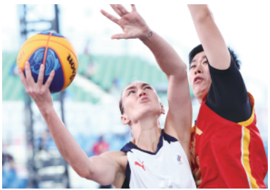
图2：7月28日，俄罗斯女子三人篮球运动员洛古诺娃在比赛中。