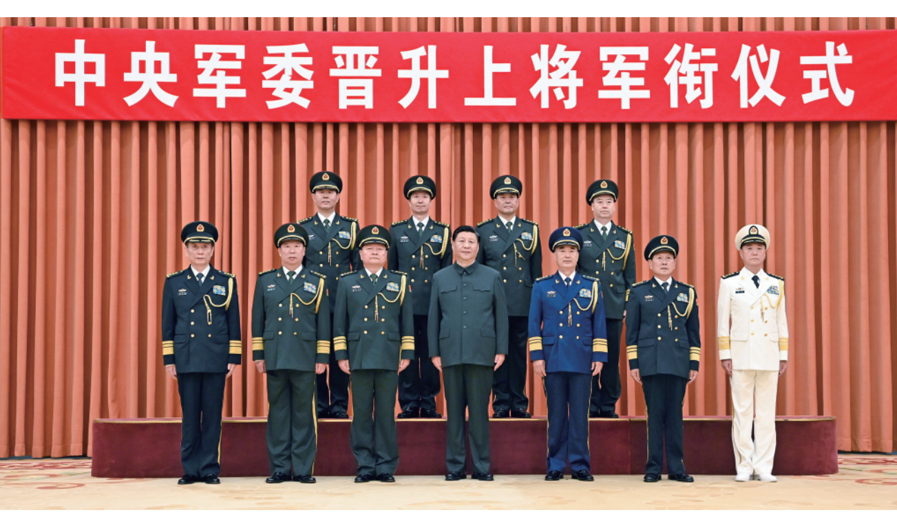
这是习近平等领导同志同晋升上将军衔的军官合影。

新华社北京 7 月 5 日电(记者梅常伟)中央军委晋升上将军衔仪式 5 日在北京八一大楼隆重举行。中央军委主席习近平向晋升上将军衔的军官颁发命令状。 下午 5 时 15 分许,晋衔仪式在庄严的国歌声中开始。中央军委副主席许其亮宣读了中央军委主席习近平签署的晋升上将军衔命令。中央军委副主席张又侠主持晋衔仪式。 这次晋升上将军衔的军官是:南部战区司令员王秀斌、西部战区司令员徐起零、陆军司令员刘振立、战略支援部队司令员巨乾生。 晋升上将军衔的 4 位军官军容严整、精神抖擞来到主席台前。习近平向他们颁发命令状,表示祝贺。佩戴了上将军衔肩章的 4 位军官向习近平敬礼,向参加仪式的全体同志敬礼,全场响起热烈掌声。 晋衔仪式在嘹亮的军歌声中结束。随后,习近平等领导同志同晋升上将军衔的军官合影。 中央军委委员魏凤和、李作成、苗华、张升民,以及军委机关各部门、驻京大单位主要领导等参加晋衔仪式。