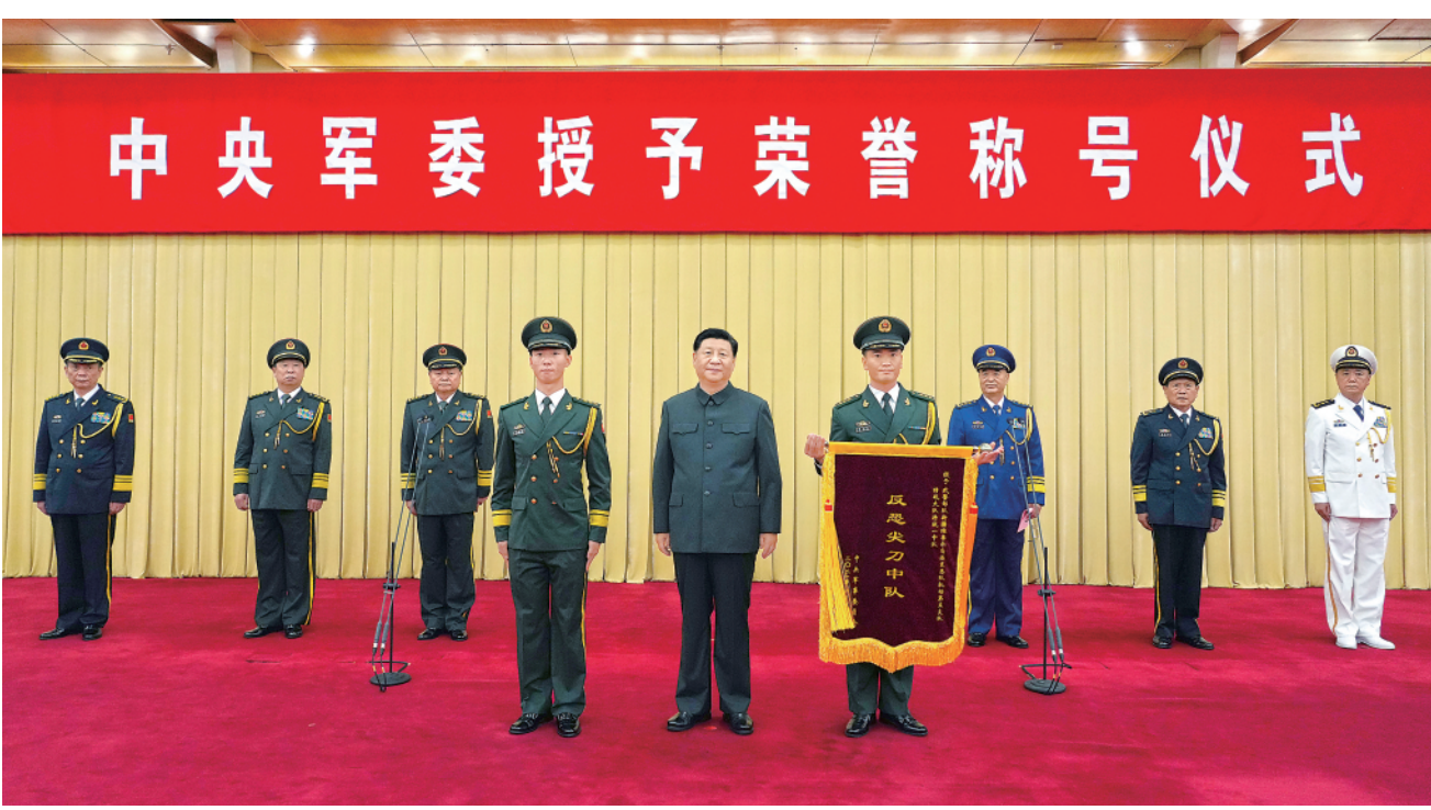
习近平向获得“反恐尖刀中队”荣誉称号的武警部队新疆维吾尔自治区总队某机动支队特战大队特战 1 中队颁授奖旗，并同该中队代表合影留念。

新华社北京 7 月 5 日电(记者梅常伟)中央军委授予荣誉称号仪式 5 日在京隆重举行。中央军委主席习近平向获得荣誉称号的单位颁授奖旗。 八一大楼仪式现场,官兵代表整齐列队,气氛庄重热烈。下午 4 时 50 分许,18 名礼兵正步入场,持枪伫立两侧,授称仪式开始,全场齐声高唱国歌。中央军委副主席许其亮宣读了习近平签署的中央军委授予荣誉称号命令,中央军委副主席张又侠主持仪式。 习近平向获得“反恐尖刀中队”荣誉称号的武警部队新疆维吾尔自治区总队某机动支队特战大队特战 1 中队颁授奖旗,并同该中队代表合影留念。 授称仪式在嘹亮的军歌声中结束。中央军委委员魏凤和、李作成、苗华、张升民,以及军委机关各部门、驻京大单位主要领导等参加授称仪式。 新华社北京 7 月 5 日电中央军委主席习近平日前签署命令,授予武警部队新疆维吾尔自治区总队某部特战一中队“反恐尖刀中队”荣誉称号。 命令要求,全军部队要向该中队学习,加强党的创新理论武装,牢记初心使命,传承红色基因,打牢听党话、跟党走的思想政治根基;练就克敌制胜的过硬本领,坚持以战领训、以训促战,全面提高训练水平和打赢能力,确保一旦有事能上得去、打得赢;培养迎敌亮剑的英勇作风,大力弘扬我军特有的革命精神,磨砺战斗意志,锤炼战斗品质,面对考验勇往直前,面对危险无惧无畏,锻造新时代革命军人的血性胆气。 中央军委号召,全军部队和广大官兵要坚持以习近平新时代中国特色社会主义思想为指导,深入贯彻习近平强军思想,深入贯彻新时代军事战略方针,增强“四个意识”、坚定“四个自信”、做到“两个维护”,贯彻军委主席负责制,不断提高政治判断力、政治领悟力、政治执行力,毫不动摇坚持党对军队绝对领导,坚持政治建军、改革强军、科技强军、人才强军、依法治军,全面提高捍卫国家主权、安全、发展利益的战略能力,为实现党在新时代的强军目标、把人民军队全面建成世界一流军队不懈奋斗。