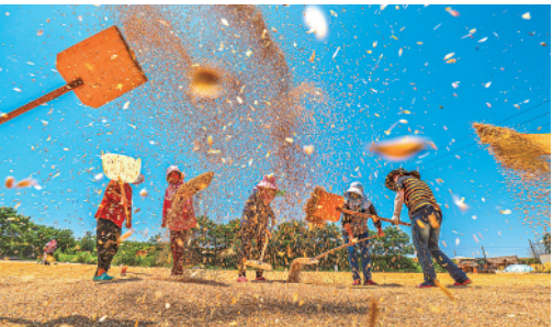
6月19日，在山东荣成上庄镇西涝村晒场，村合作社的社员们在晾晒小麦。

强之路。”参观完展览的黎巴嫩驻华大使米莉亚·贾布尔说。 长江与东海交汇处，上海洋山深水港桥吊林立。这里已是全球集装箱作业最繁忙港区之一，每年吞吐2000多万个标准集装箱，首尾相连可绕地球3圈多。 洋山港圆了百多年前孙中山《建国方略》中“东方大港”的梦想，标注了中国共产党领导下，一个泱泱大国写下的东方奇迹。 从新中国成立之初的一穷二白到如今超百万亿元规模的世界第二大经济体、第一大工业国、第一大货物贸易国、第一大中等收入群体规模国家；从基本解决温饱，到人民生活总体达到小康水平，再到全面建成小康社会、彻底摆脱绝对贫困…… 了解从哪里来，更能读懂今日之中国。 1840年鸦片战争后，古老的中国陷入苦难深渊。无数仁人志士苦寻救亡图存之道，直到百年前中共一大的召开，如黑暗中的灯火，点亮民族独立、人民解放的希望。