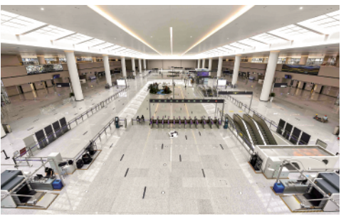
6月23日拍摄的成都天府国际机场交通中心的换乘大厅。成都天府国际机场将于6月27日正式投运。