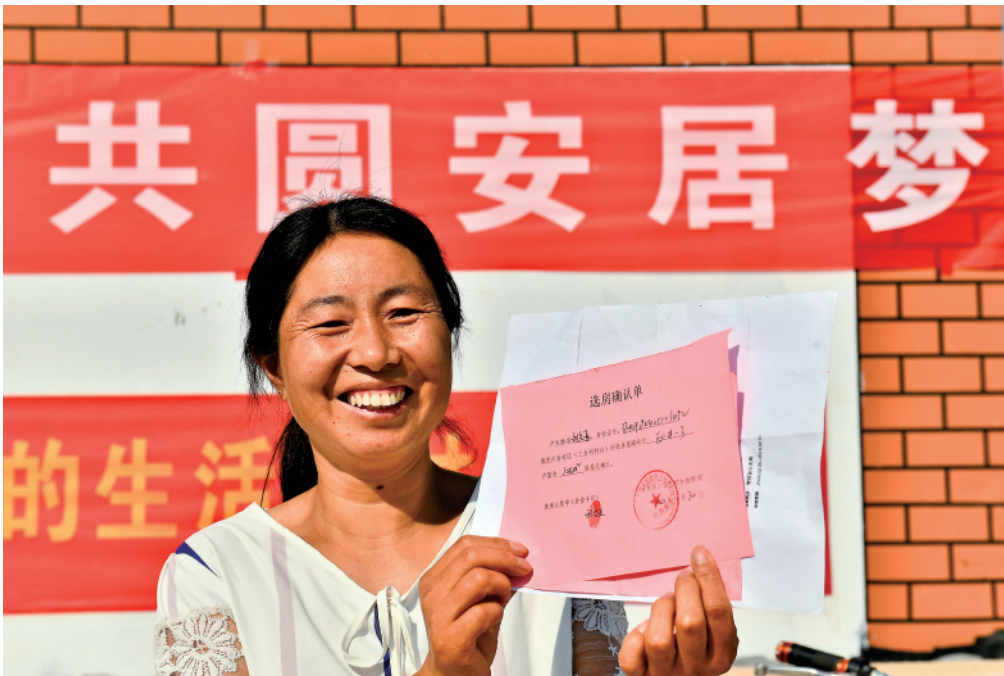
在菏泽市鄄城县旧城镇六合社区(三合村村台),王庄村村民在展示自己的选房确认单(2020年9月20日摄)。

时序更替,梦想前行。 灌溉难、吃水难、用电难、出行难、上学难、就医难、安居难、娶亲难,黄河滩区人,祖