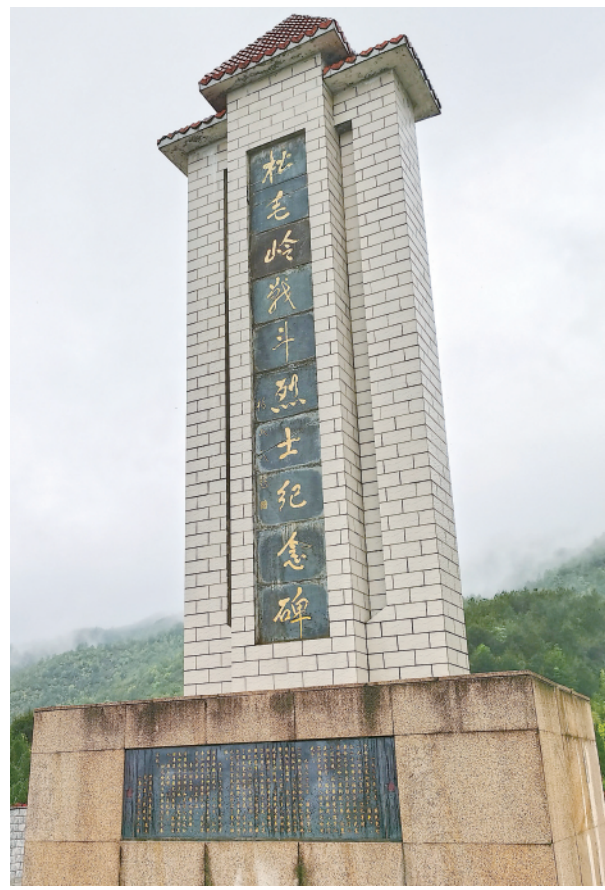
位于长汀的松毛岭战斗烈士纪念碑(4月27日摄)。