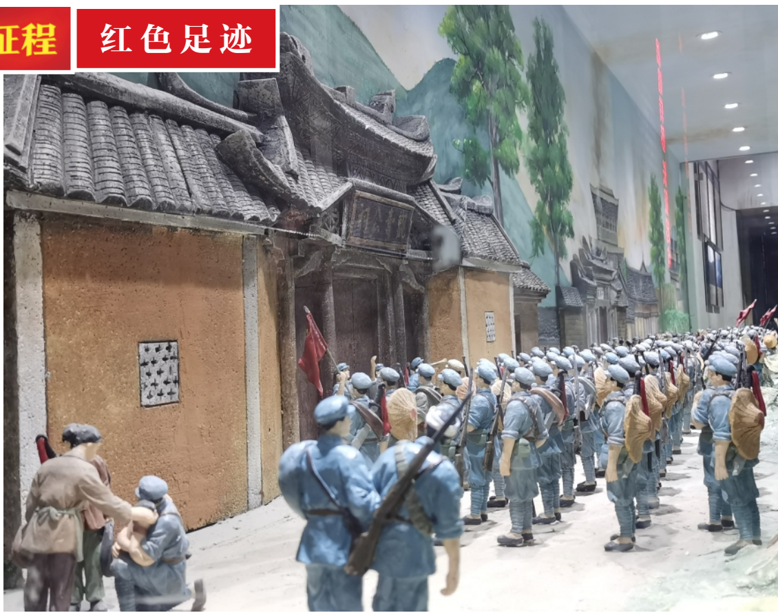
在福建省长汀县中复村拍摄的红军长征出发动员会微型雕塑(4月27日摄)。

闽西龙岩、三明,是原中央苏区核心区。土地革命时期,10万闽西子弟参加红军,2.6万多人参加长征,开路先锋、断后阻击,血战湘江、强渡乌江、飞夺泸定桥……2.4万多人牺牲在路上,平均一里路牺牲一名闽西