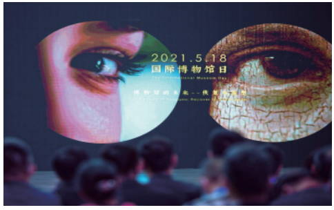
5月18日是国际博物馆日,观众在首都博物馆观看2021年“国际博物馆日”中国主场活动宣传片。