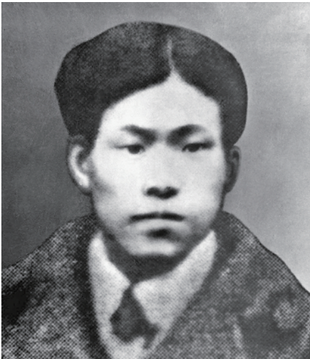
蔡和森像(资料照片)。

从1925年起,瞿秋白先后在党的第四、五、六次全国代表大会上,当选为中央委员、中央局委员和中央政治局委员,成为中国共产党的重要领导人。