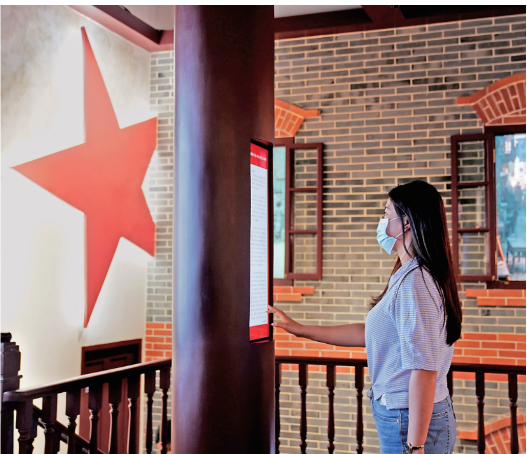
5月8日,观众通过电子触摸屏阅读烈士家书。

着对革命理想的热烈追求,远渡重洋赴法勤工俭学。他在法国感受着异国文明的冲击和思想潮流的激荡,“猛看猛译”马克思主义著作,翻译《共产党宣言》《社会主义从空想到科学的发展》等著作的重要段落,宣传俄国十月革命及各国工人运