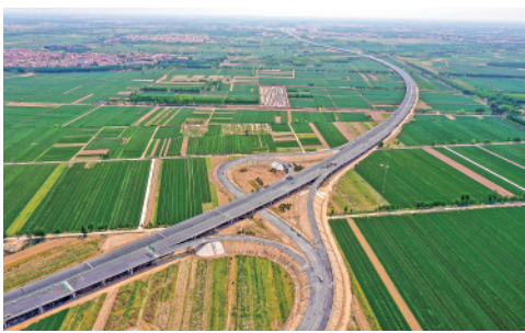
目前,京德(北京大兴国际机场至山东德州)高速(一期工程)进入通车倒计时阶段,5月底将实现全线通车。

今日 12 版 总第 10359 期 / 国内统一连续出版物号 CN 11-0209 邮发代号 1-19 / 新华网:news.cn 新华每日电讯网:mr dx.cn