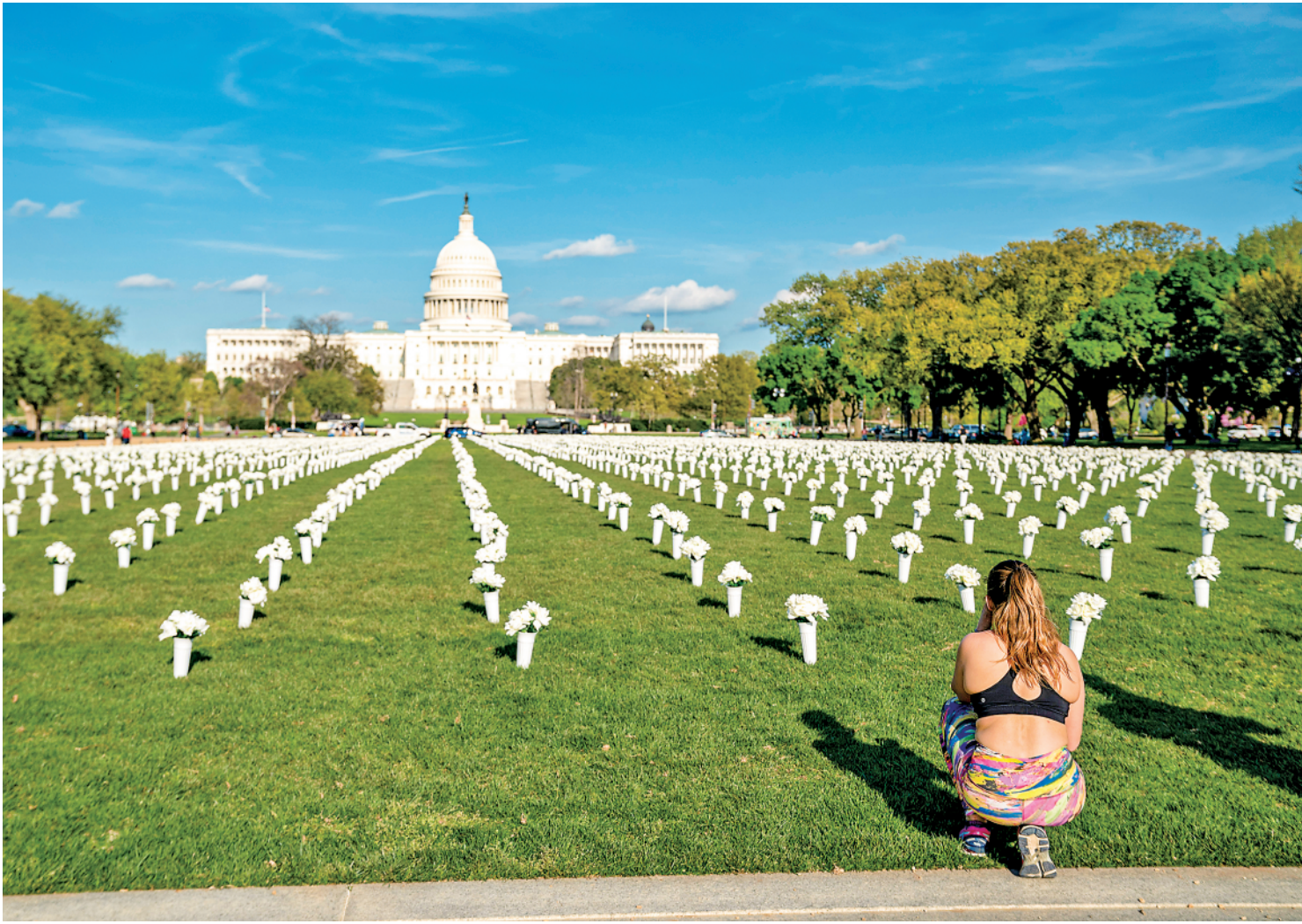
华盛顿:四万绢花纪念枪击遇难者

新华社东京 4 月 14 日电(记者王子江)东京奥运会 14 日进入最后 100 天冲刺,但新冠疫情再次卷土重来,从中央到地方显示出对抗疫深深的无力感;测试赛上演狗血剧情,取消与推迟轮番上演;火炬接力顺利进行了 19 天后,在大阪遇到重大挫折。倒计时 100 天不是纪念日,倒是为日本各方设置的叫醒钟。 日本政府的心思最近似乎一点都没有用在奥运会上,首相菅义伟在积极准备 16 日的访美,走前还召开内阁会议,正式决定将福岛第一核电站上百万吨核废水排入大海,最迫在眉睫的抗疫问题,却实行了保守治疗,暴露了各方在这个问题上的一筹莫展。 但病毒并不会因为奥运的到来延缓扩散的速度。全日本疫情恶化速度加快,东京都的确诊病例连续超过 500 例,大阪府