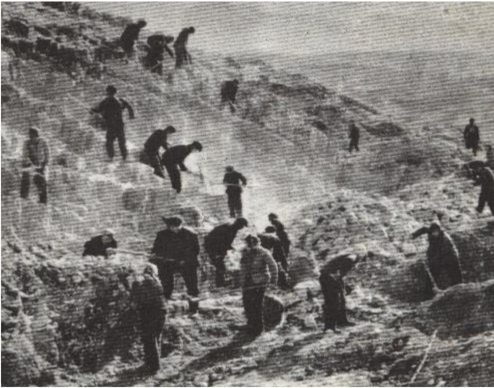
上图:沙石峪全景(资料照片)。