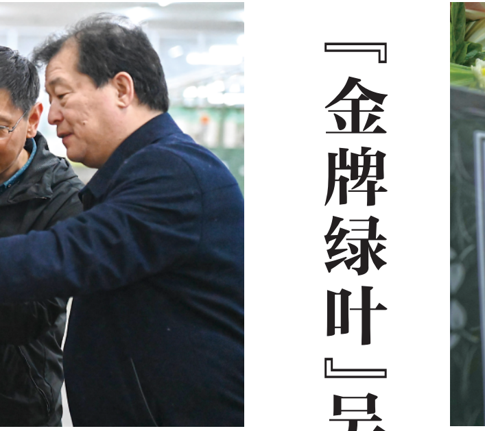
3月7日，在位于香港殡仪馆的世界殡仪馆拍摄悼念吴孟达活动现场。

新华社香港3月14日电(记者丁梓懿)7日下午，骤雨初歇，阴天微凉，位于香港红磡的世界殡仪馆显得更加肃穆。