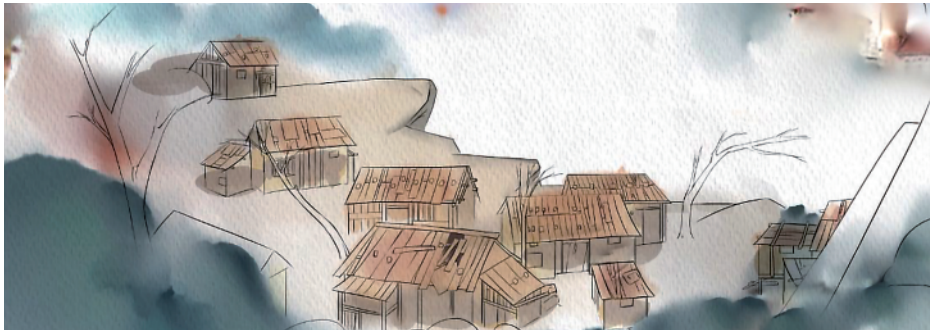
《梦中的阿嫲》场景设计草图。