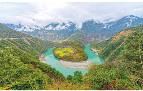
3月7日拍摄的怒江第一湾。绵延数百公里的高黎贡山，与怒江和碧罗雪山共同构成雄奇的怒江大峡谷。