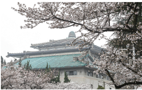
3月8日，武汉大学开始接待预约游客进校赏樱花。今年樱花开放期间，武大设立抗疫医护赏樱绿色通道。