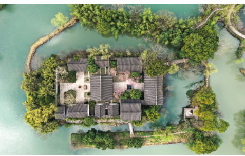
3月2日拍摄的西溪湿地内一处景观(无人机照片)。早春时节,浙江杭州西溪湿地新绿初绽,春光明媚。