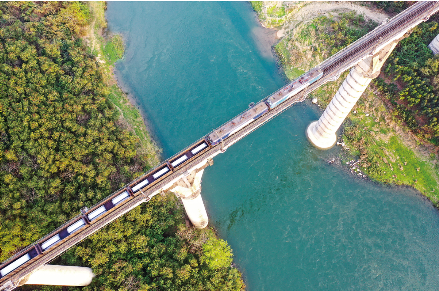
一列火车开行在南盘江铁路大桥上(2月24日摄,无人机照片)。南昆线上繁忙的列车穿过千山万壑,与小站、河流、村舍构成一幅幅别样景观。