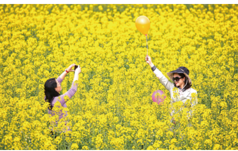
2月27日,两名游客在成都市金堂县三溪镇长林村油菜花田里拍照。