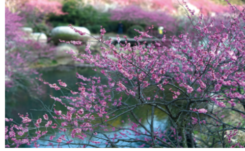
近期,气温回暖,浙江省长兴县东方梅园5000多株梅花盛放,吸引游客前来赏梅踏青(2月23日摄)。