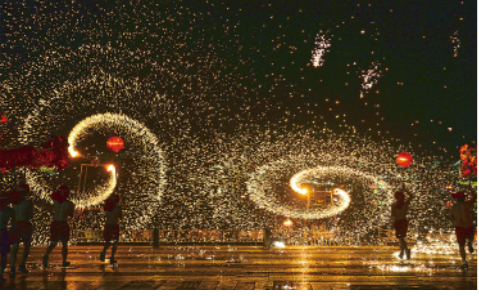
湖南长沙市铜官窑古镇“打铁花”表演(2月26日摄)。当日是农历正月十五元宵节,各地人们欢喜闹元宵。