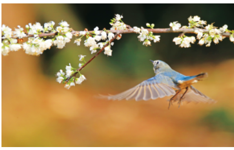
2月22日,在湖南衡阳市雁峰区五星村的山林里,一只小鸟在林间嬉戏。连日来,随着气温回升,湖南衡阳春意盎然。