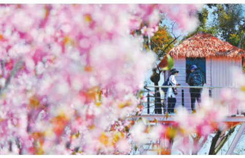
近日,位于福州市闽侯县上街镇沙堤村的鲤鱼洲樱花岛上樱花陆续绽放,游客纷纷前来赏景(2月21日摄)。