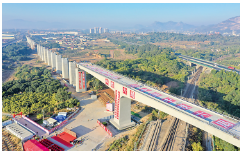
1月21日,跨越鹰厦铁路的新建福厦铁路九龙江特大桥转体桥成功转体。

今日12版 总第10254期 / 国内统一连续出版物号CN 11-0209 邮发代号1-19 / 新华网:news.cn 新华每日电讯网:mr dx.cn