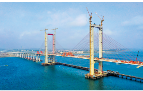
1月25日,湛江调顺跨海大桥成功合龙,对加快广东粤西片区经济发展发挥重要连通作用。