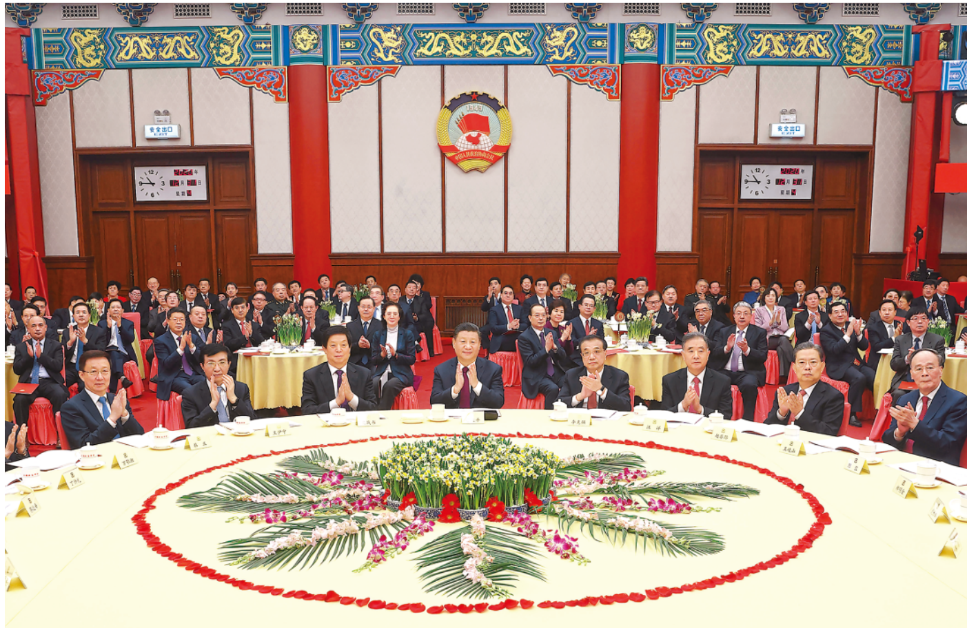
12月31日,全国政协在北京举行新年茶话会。党和国家领导人习近平、李克强、栗战书、汪洋、王沪宁、赵乐际、韩正、王岐山出席茶话会并观看演出。