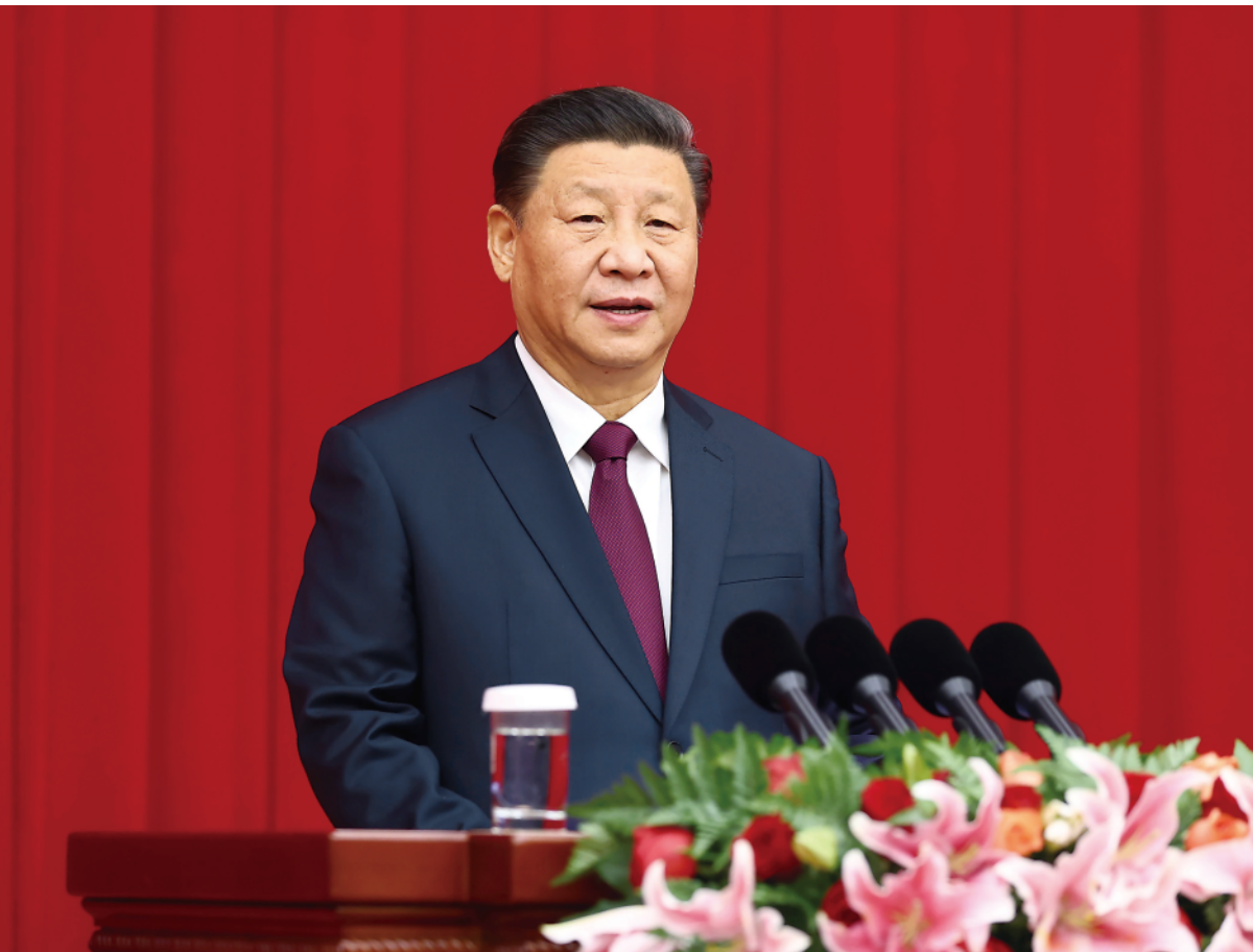
12月31日,全国政协在北京举行新年茶话会。中共中央总书记、国家主席、中央军委主席习近平在茶话会上发表重要讲话。