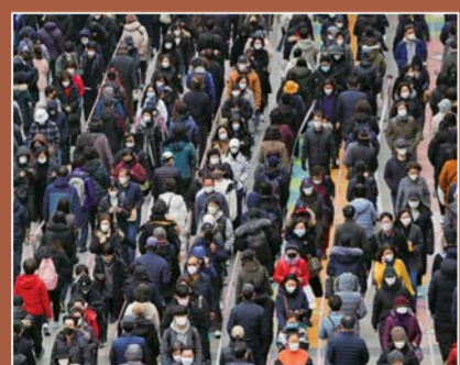
▲①世纪疫情冲击全球考验担当:3月3日,人们在韩国首尔排队购买口罩。

12月24日,英国和欧盟就包括贸易、安全等在内的一系列合作关系问题达成历史性协议,漫长曲折的“脱欧”进程基本画上句号。这一协议给英欧未来经贸合作注入确定性,使双方避免因出现“无协议脱欧”而“双输”。英国“脱欧”改变欧盟版图,对欧洲乃至世界政治、经济格局影响深远。“后脱欧时代”英欧关系如何发展备受关注。