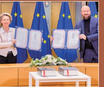
▲⑩英欧达成协议避免“双输”:12月30日,欧盟签署与英国就未来关系达成的协议。