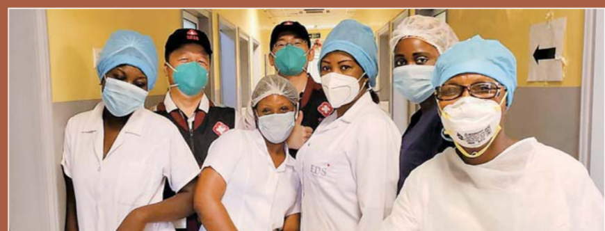
▲②人类命运共同体彰显感召力:5月26日,中国抗疫医疗专家组在刚果(布)首都布拉柴维尔指导新冠肺炎病房建设时,与当地一线医务人员合影。