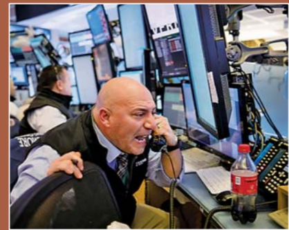
▲⑧世界经济遭重创陷深度衰退:3月18日,纽约股市出现当月的第四次熔断。