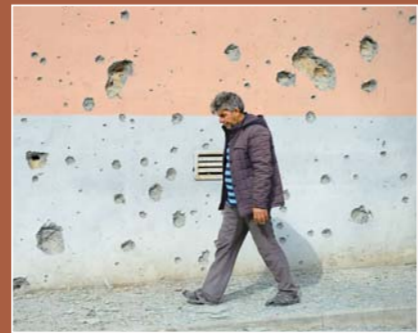
▲⑦纳卡硝烟再起侵蚀地缘安全:9月29日,在阿塞拜疆的塔塔尔,墙壁布满弹孔。