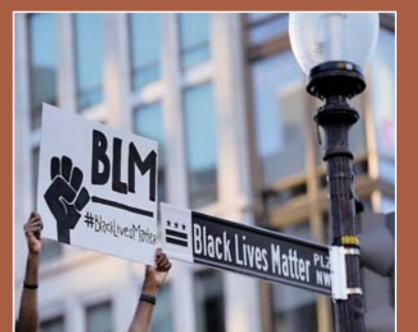
▲④种族矛盾暴露美国人权痼疾:六月八日,市民在华盛顿手举“黑人的命也是命”标语。