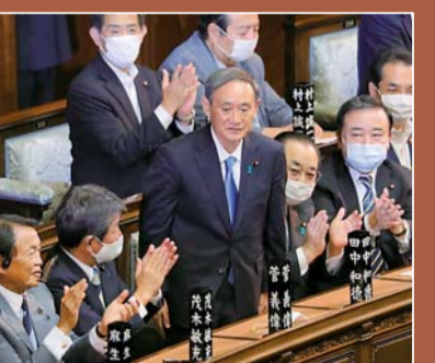
▲⑤安倍时代落幕政策基本延续:9月16日,新当选的日本首相菅义伟起身致谢。