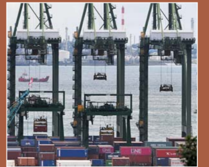
▲⑨RCEP 签署为多边合作增添动力:这是8月17日的新加坡巴西班让集装箱码头。