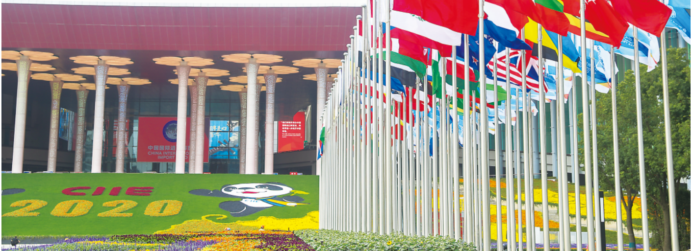
▲这是11月2日拍摄的进博会场馆——国家会展中心(上海)南广场。

新中国成立以来规模最大的全球人道主义行动,向150多个国家和10个国际组织提供抗疫援助;向34个国家派出36支医疗专家组;发挥最大医疗物资产能国优势,向各国提供了2000多亿只口罩、20亿件防护服、8亿份检测试剂盒。