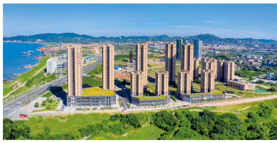
▲6月17日拍摄的实现绿色转型发展后的株洲市清水塘部分城区新貌(无人机照片)