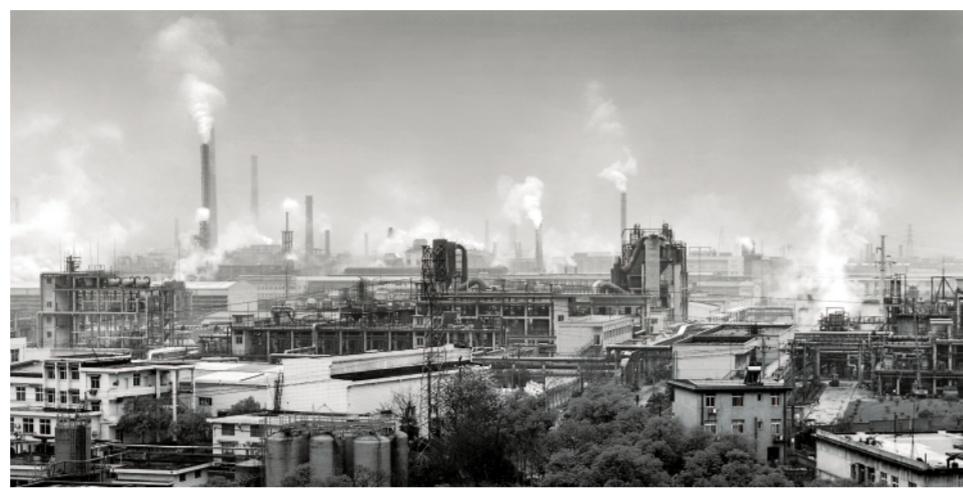
▲2009年拍摄的株洲市清水塘老工业区(资料照片)

“我们愿与东盟各国进一步对接创新发展战略,共同实施‘一带一路’科技创新行动计划和中国—东盟科技伙伴计划,建设更为紧密的中国—东盟科技创新伙伴关系。”王志刚说。