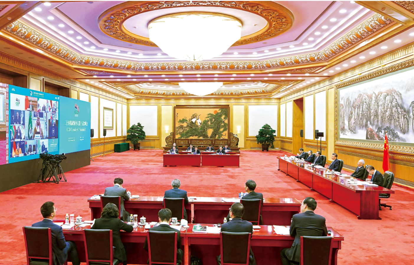
▲11月21日晚，国家主席习近平在北京以视频方式出席二十国集团领导人第十五次峰会第一阶段会议并发表重要讲话。