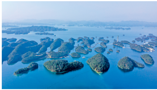
庐山西海美景如画

这是 11 月 7 日拍摄的庐山西海(无人机照片)。秋末冬初，江西庐山西海在阳光下波光粼粼，美不胜收。