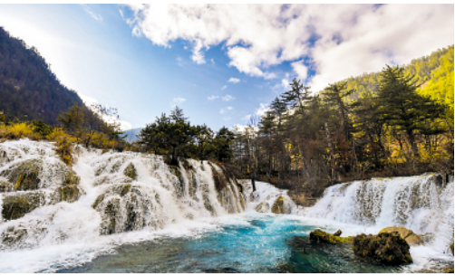
九寨沟灾后重建基本完工

历经三年，九寨沟灾后重建基本完成，项目完工率达 93.03%。这是 11 月 7 日拍摄的九寨沟景区一景。