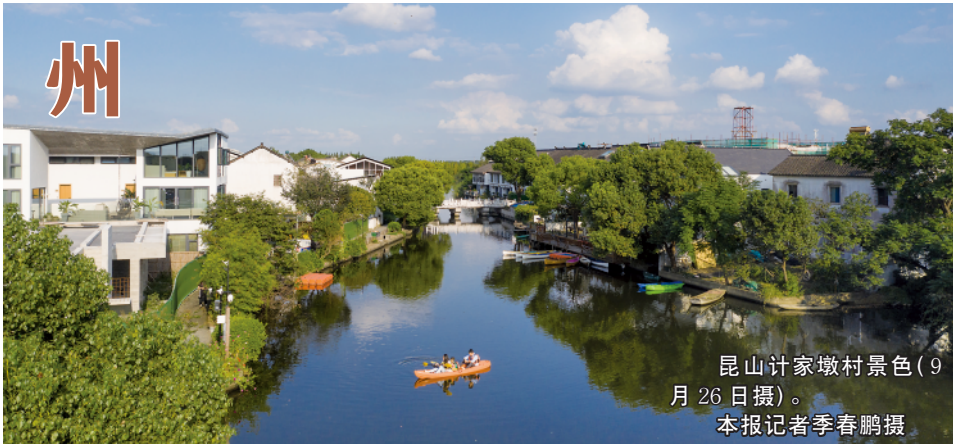
昆山计家墩村景色(9月26日摄)

之道，解开苏州产业成长密码，到由细微处感受民生温度，探究如何打造一生之城……本报记者立足新发展理念，全面解析以人民为中心的城市该如何规划布局、建设治理。 园林水巷，城景宜人；经济领跑，产业地标；文脉赓续，吴风悠扬；民情雅致，生活怡然。2500 多年，苏州不老；苏州气质涵养出苏州的生命力！本报《调查观察》周刊今日推出特别报道《问道苏州》，希望苏州实践为新时代城市永续发展提供启示。 (5-8 版)