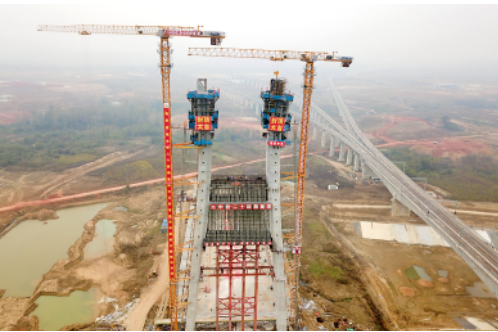
引江济淮将军岭路桥主塔封顶

10月28日,位于合肥市的引江济淮将军岭路桥主桥主塔顺利封顶。