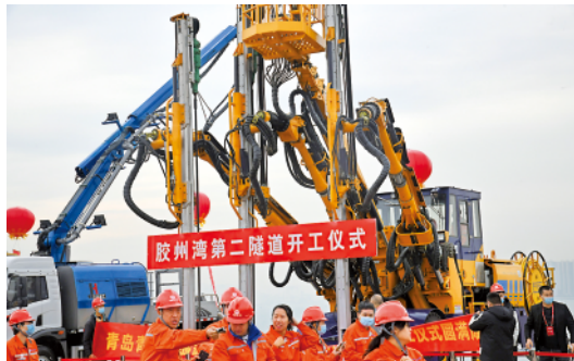
青岛开建第二条胶州湾海底隧道

10月29日,青岛市开建第二条胶州湾海底隧道,主线隧道长15.89公里。