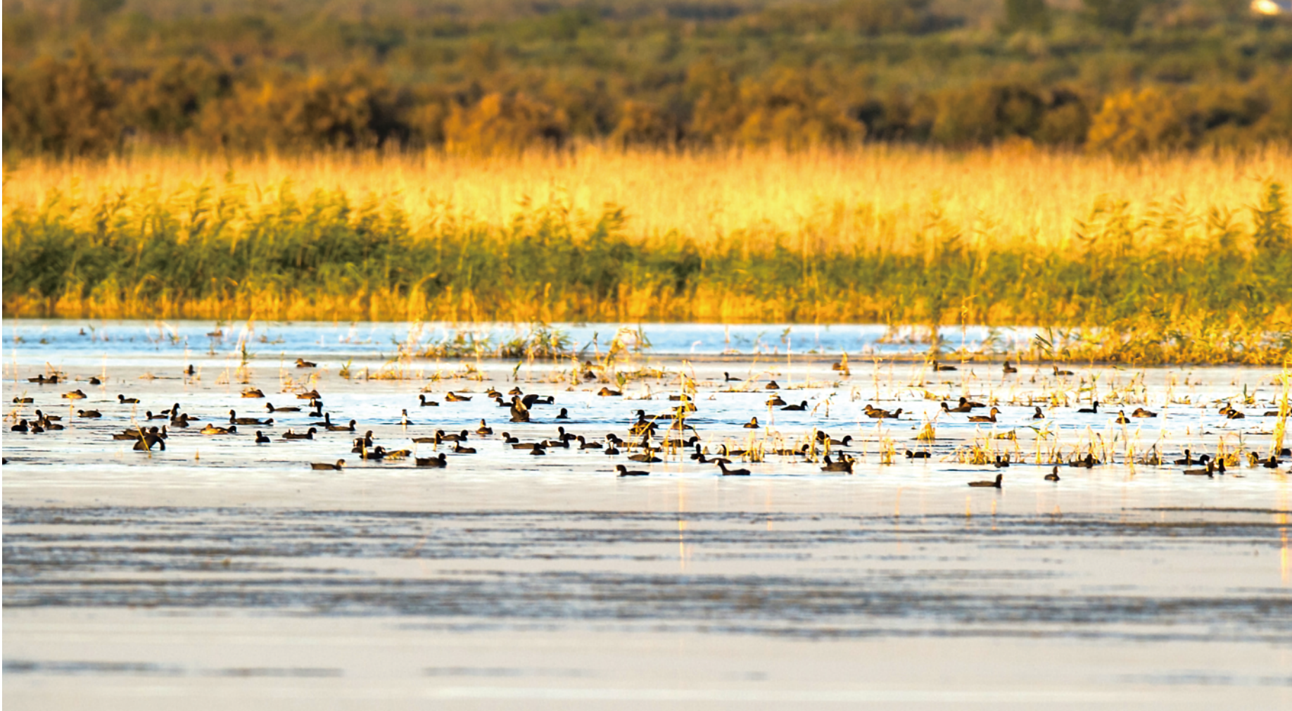
▲拼版照片：上图：上世纪70年代，内蒙古鄂尔多斯市乌审旗农牧民治沙的资料照片；下图：9月7日在内蒙古鄂尔多斯市乌审旗拍摄的毛乌素沙地。 ▲7月28日，成群候鸟在桃力庙—阿拉善湾海子觅食。