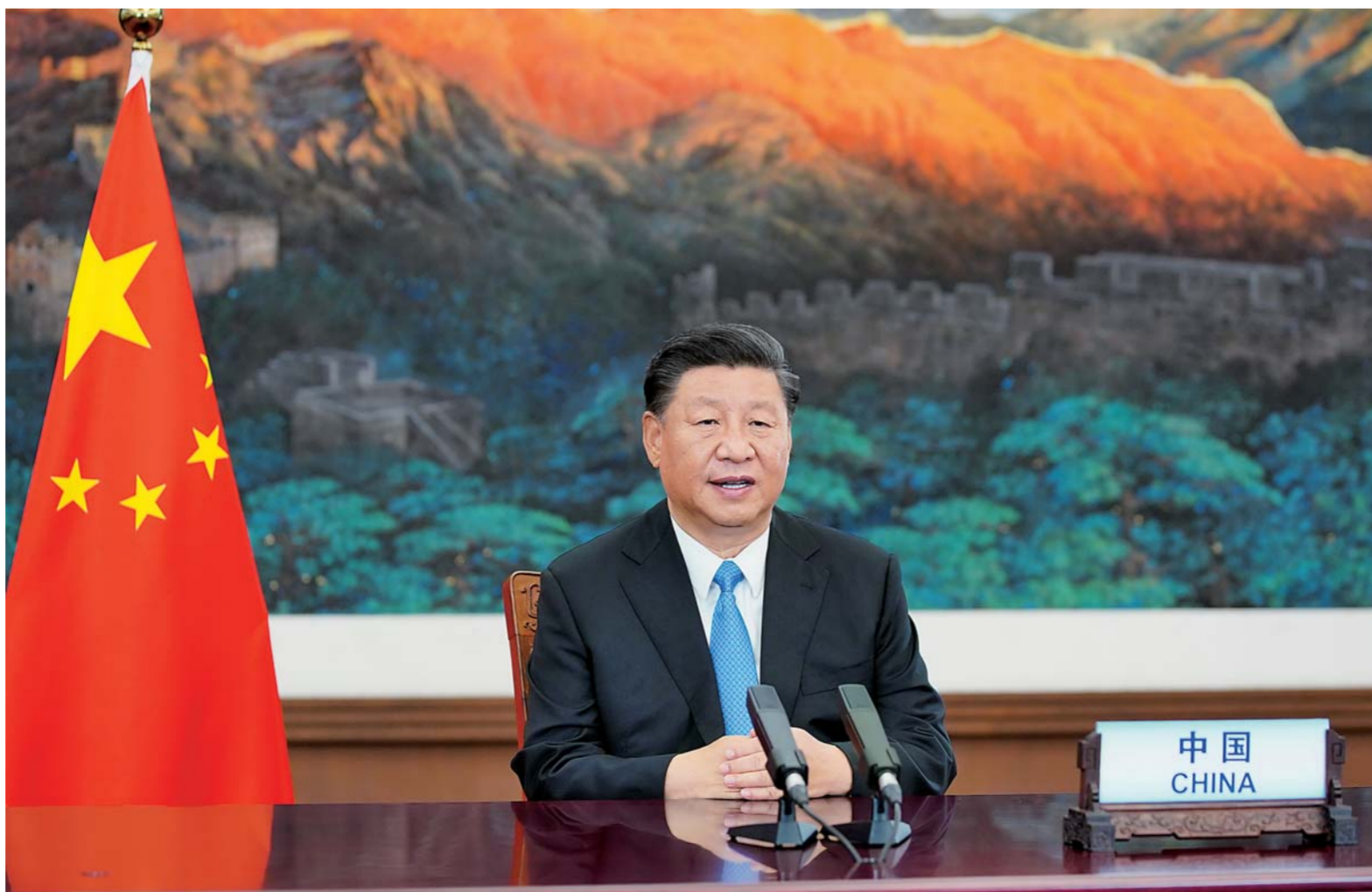
▲9月22日,国家主席习近平在第七十五届联合国大会一般性辩论上发表重要讲话。