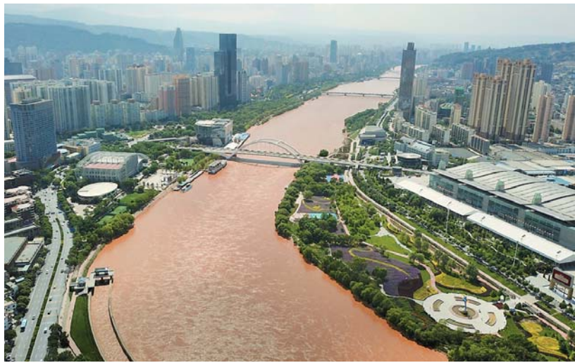
八月十二日拍摄的黄河兰州段景象。