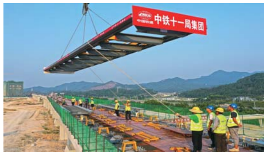
清远磁浮旅游专线开始铺轨

9月2日,广东清远磁浮旅游专线开始铺轨。清远磁浮旅游专线是广东首条中低速磁浮线,预计年底完工。