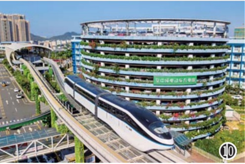
图1：20世纪80年代初的深圳渔民村（资料照片）。 图3：深圳市蛇口工业区办公大厦旁挂着“时间就是金钱，效率就是生命”标语牌（资料照片）。 图4：2018年12月18日在深圳市南山区蛇口地区拍摄的时间广场（无人机照片）。 图5：20世纪80年代，打工者在蛇口工业区凯达玩具厂工作。 图6：8月12日，在深圳福田区粤港澳青年创新创业工场，一家创业企业的员工在工作。 图7：1992年5月，在深圳市证券营业部门前，人们排队等候购买股票。 图8：8月24日拍摄的深圳证券交易所。 图9：这是兴建中的蛇口工业区一角（资料照片）。 图10：“云轨”列车在位于深圳的比亚迪总部运行调试（2018年11月30日摄，无人机照片）。