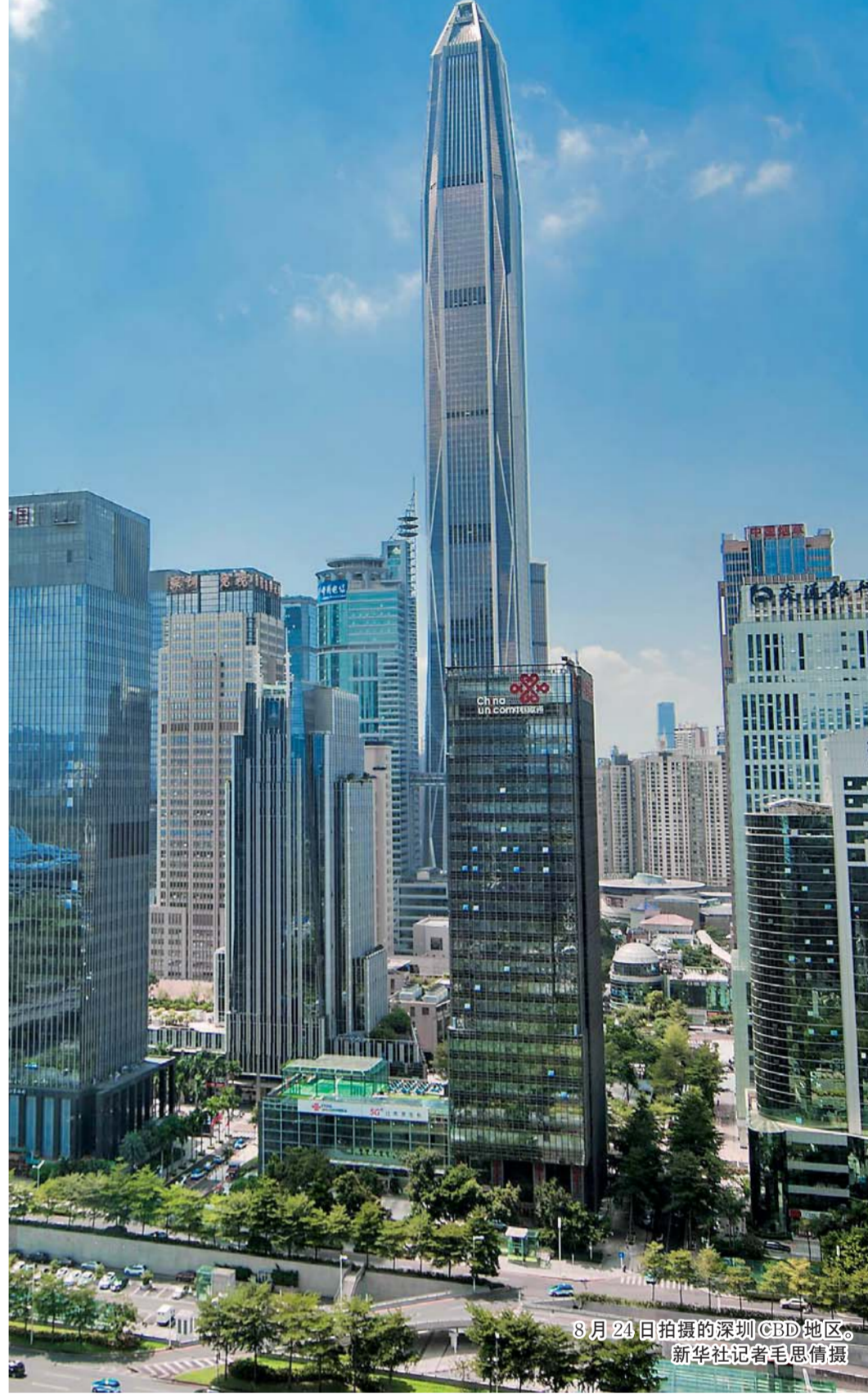
8月24日拍摄的深圳CBD地区。